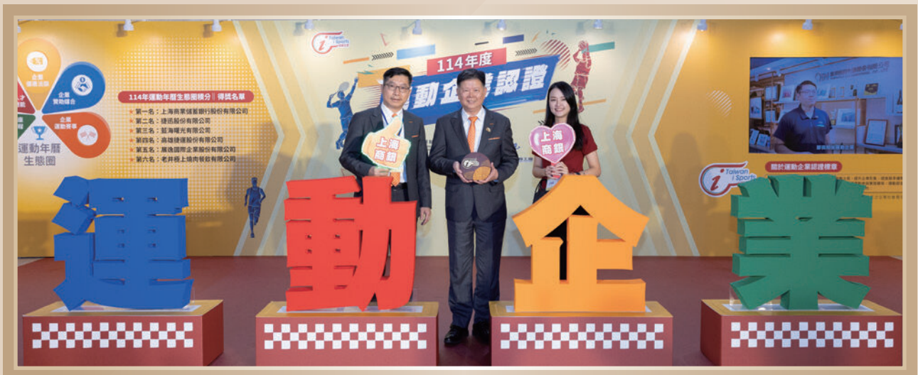
▶ 經營成果豐碩，屢獲各界肯定 ◀