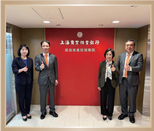
▲ 高雄資產管理專區開業