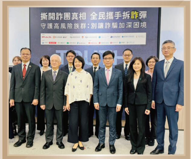
▲ 聯合報撕開詐團真相 全民攜手拆詐彈防詐系列論壇