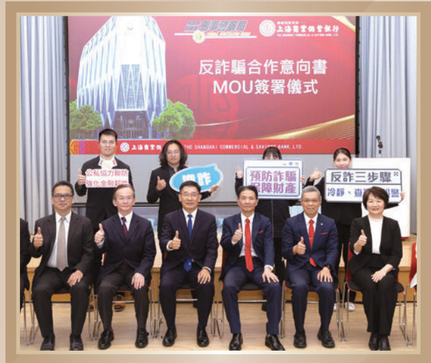
▲ 本行與內政部警政署刑事警察局反詐騙合作意向書 MOU 簽署儀式