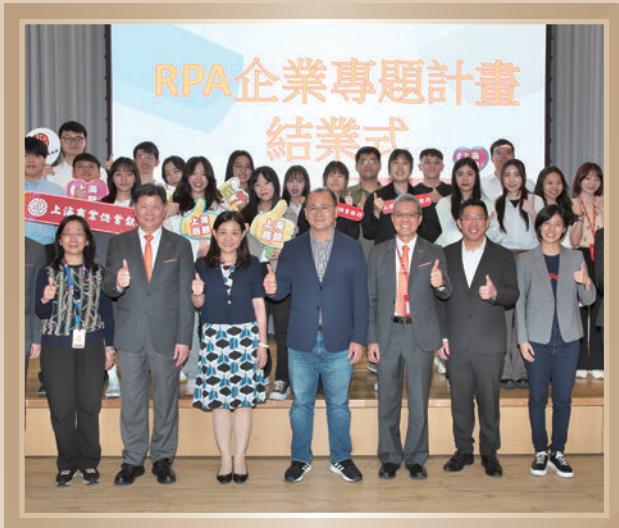
▲ RPA 企業專題計畫結業典禮