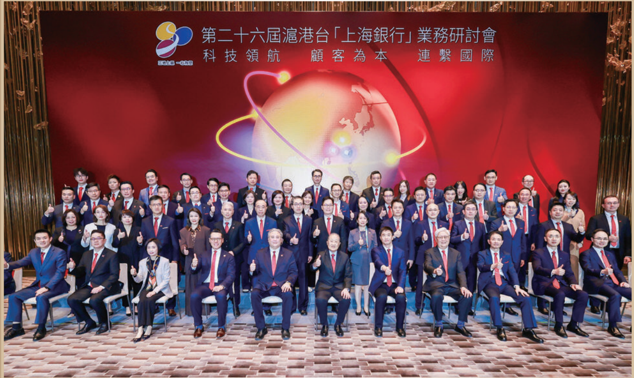
▲ 滬港台「上海銀行」業務研討會