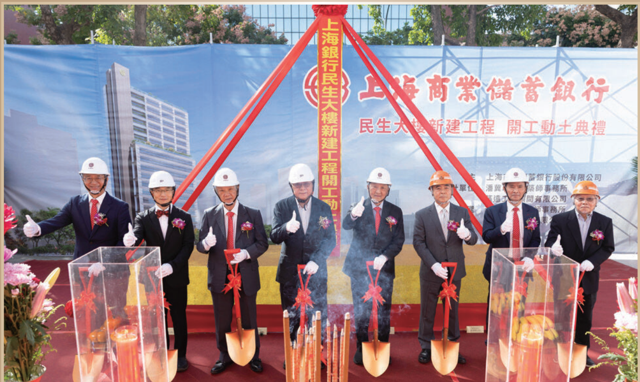
▲ 民生大樓新建工程開工動土典禮