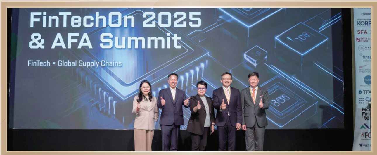
▲ FinTechOn 2025 暨 AFA 高峰會