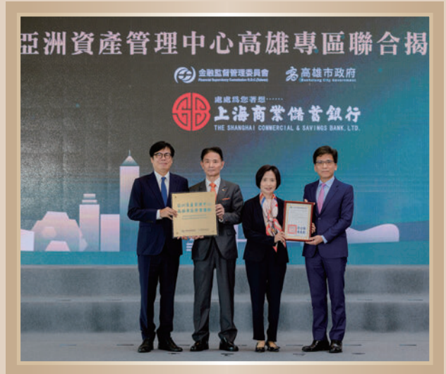
▲ 亞洲資產管理中心高雄專區聯合揭牌典禮