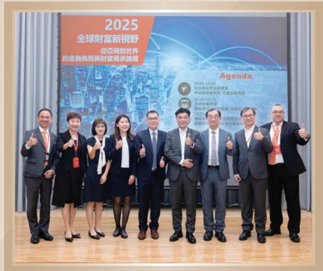
▲ 從亞灣到世界的金融佈局與財富傳承論壇