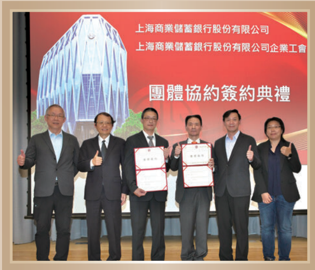
▲ 團體協約簽約典禮